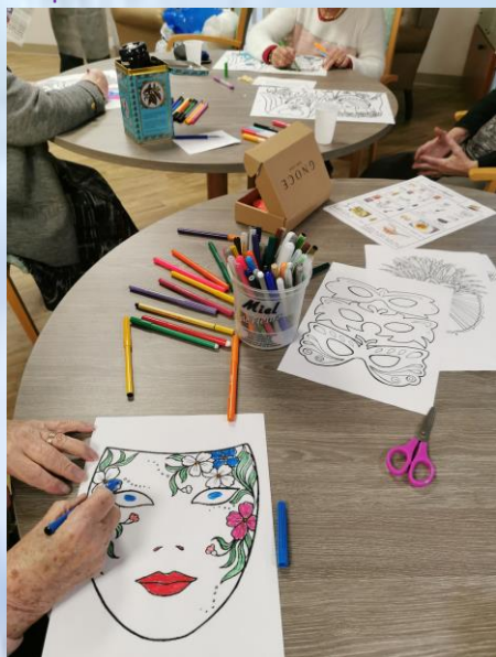
Préparation de la décoration de Carnaval